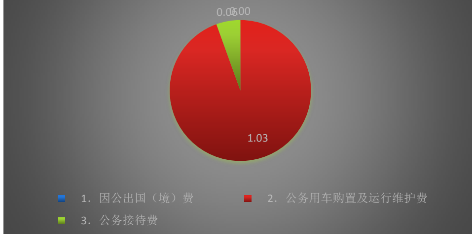
“三公”经费2019年支出结构图