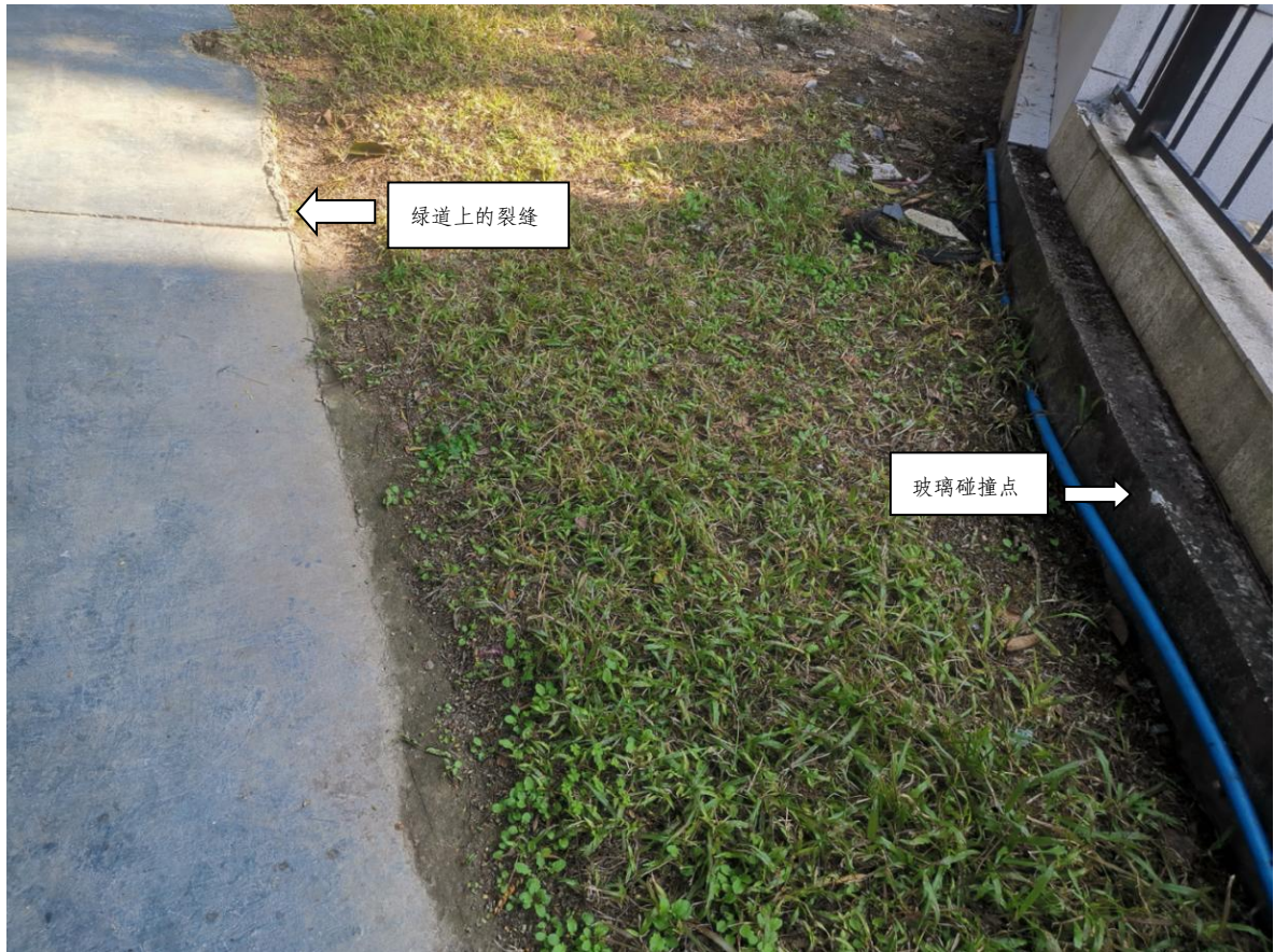
图示 3 上图为绿道上的裂缝和玻璃倒塌的碰撞点

4. 花都区狮岭镇金碧御水山庄水云台 37 号房屋后面绿道旁的草皮处由部分破碎成不规则的玻璃碎粒;