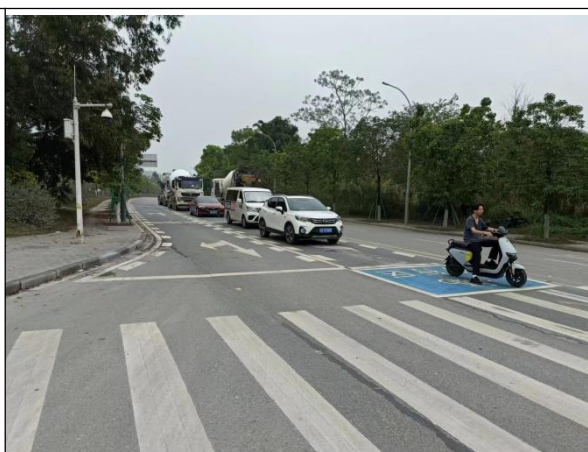
图 5 图 6