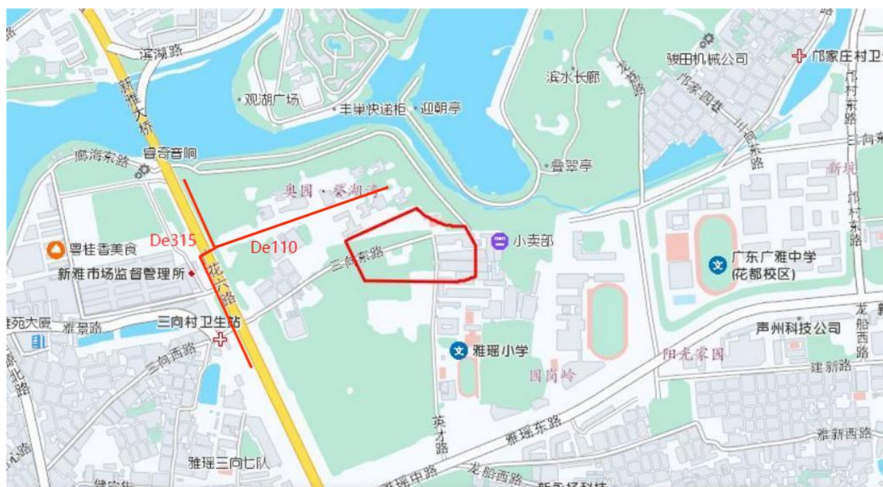
广花公路东三地块（二期）